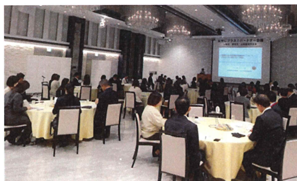
5. 9. 14 女性にプラス！パートナー会議