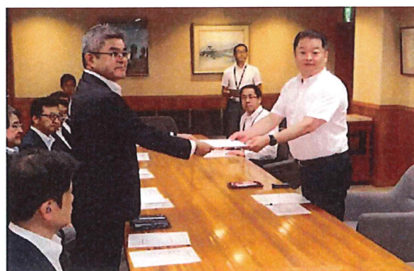
5. 8. 1 長崎知事に提言書を手交