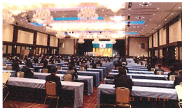
5. 1. 5 新年祝賀互例会