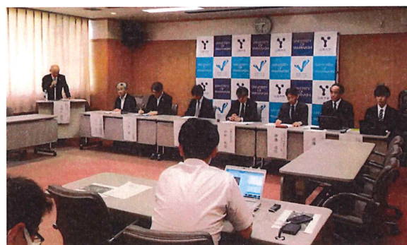
5. 7. 11 中部横断道整備効果・記者発表