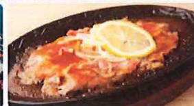
※写真は全てイメージです

日本一広いテーマパークと華やかなイルミネーションをお楽しみください。佐世保名物の軍港クルーズやレモンステーキもご堪能いただけます。