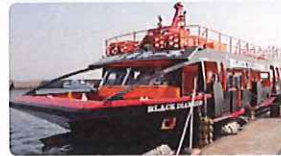
※写真は全てイメージです

多くの人を惹きつけてやまない軍艦島。その「廃墟の島」が現在でも人々の好奇心を掻き立てるのは、「島全体が繁栄当時のまま残っている」こと。廃墟でありつつも、昭和の生活を実感することが出来ます。