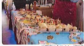
※写真は全てイメージです

船上より世界遺産に登録された小管修繕場跡やジャイアント・カンチレバークレーンをご覧ください。揺れにくい設計で、船酔いが心配な方も安心。出港時は夕景を、帰港時は長崎の夜景をお楽しみください。