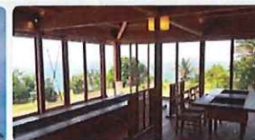
※写真は全てイメージです

長崎は離島の数、全国1位!自然、歴史、世界文化遺産「長崎と天草地方の潜伏キリシタン関連遺産」のある福江島へ