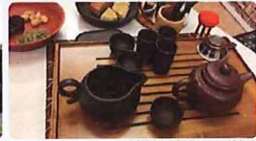
※写真は全てイメージです

ご同伴者様向けのコース。レトロ写真館では沢山の衣装の中からお気に入りの1着を選んで写真撮影をお楽しみいただけます。唐人屋敷では美味しい中国茶を自分で淹れて飲むことができます。五感で楽しむ和華蘭文化の世界をのぞいてみませんか。