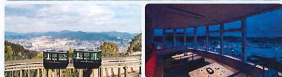
※写真は全てイメージです