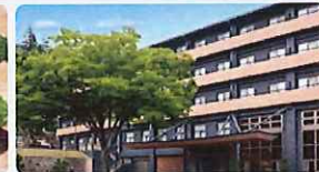
※写真は全てイメージです

「世界ジオパーク」に認定される長崎県・島原半島。湯けむり立ち上る温泉街でのご滞在をお楽しみください。