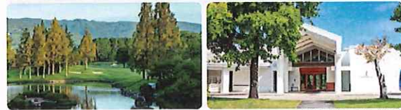
※写真は全てイメージです