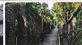
※写真は全てイメージです

外国人居留地時代の面影が残る南山手地区をご案内。坂の街ならではの風景も楽しみながら、斜面地の暮らしをリアルに体験。その中にある空き家を活用した「つくる邸」で「坂の街長崎」の未来を感じてみませんか。