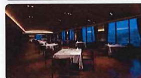
※写真は全てイメージです

長崎の各種地酒をはじめとした厳選したお酒と、中華料理のマリアージュ。上海料理をベースにした長崎近海産の新鮮な魚介類と旬野菜をふんだんに使った中華料理で、長崎の夜をお楽しみください。