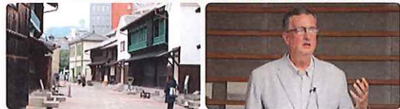
※写真は全てイメージです